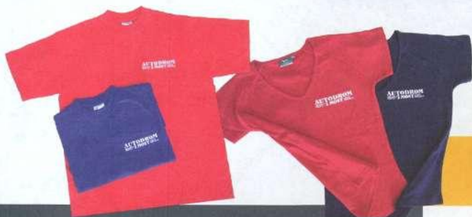
Pánské triko Classic s výšivkou 100 % bavlna 150 Kč