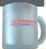
Hrnek z transparentního skla s barevným potiskem 100 Kč