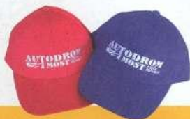
Čepice basic s výšivkou materiál keprová bavlna, suchý zip vzdušné bělo 100 Kč