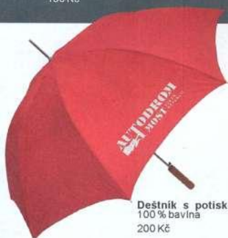
Deštník s potiskem 100 % bavlna 200 Kč