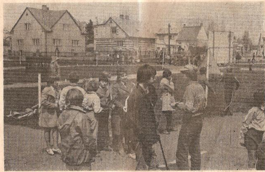
Dopravní výchova dětí a mládeže na dopravním hřišti AMK Svazarmu v Jindřichově Hradci