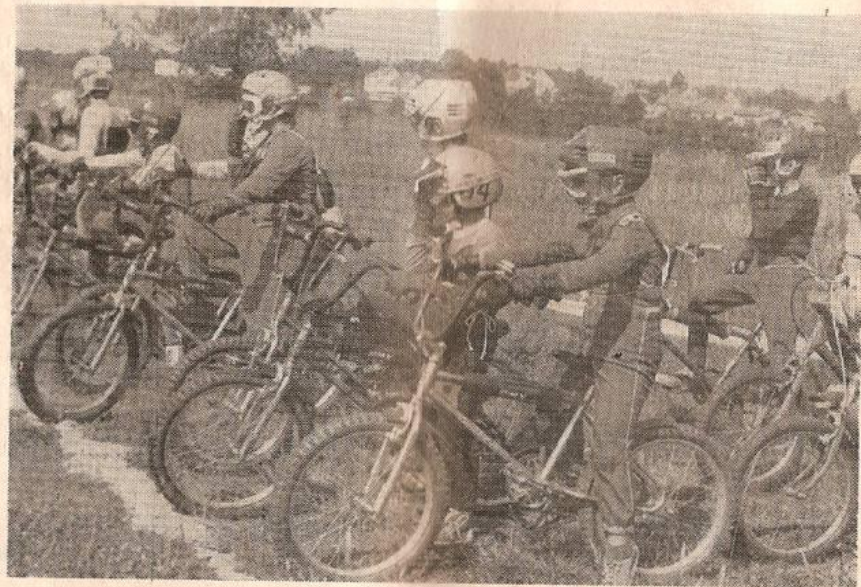
Bikros — naděje našeho motokrosu . . .