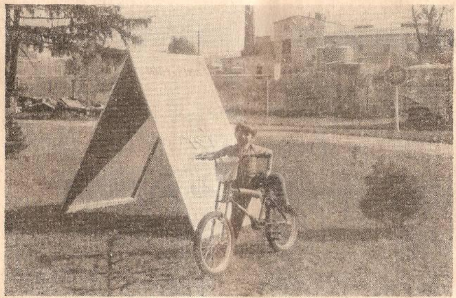
Práce s mladou generací — úkol do budoucích let