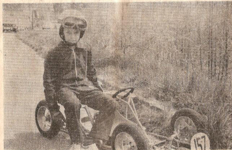
Minikárový sport — sport mladých motoristů . . .