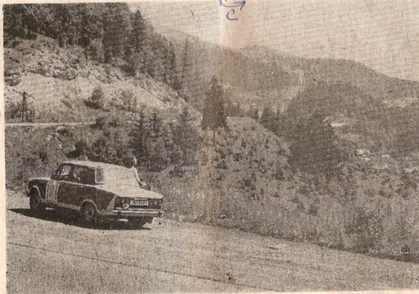
Branné automobilové soutěže = poznání krás vlasti . . .