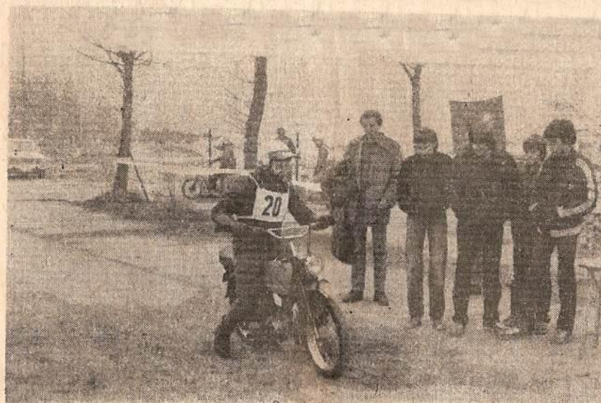
Terénní soutěže mládeže — Simson - Jawa 50 ccm