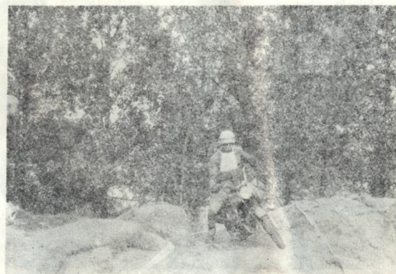
Terénní soutěže 50 ccm