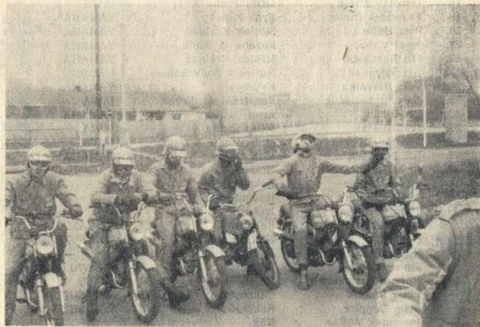
Oddíl mladých motoristů ENDURO 50