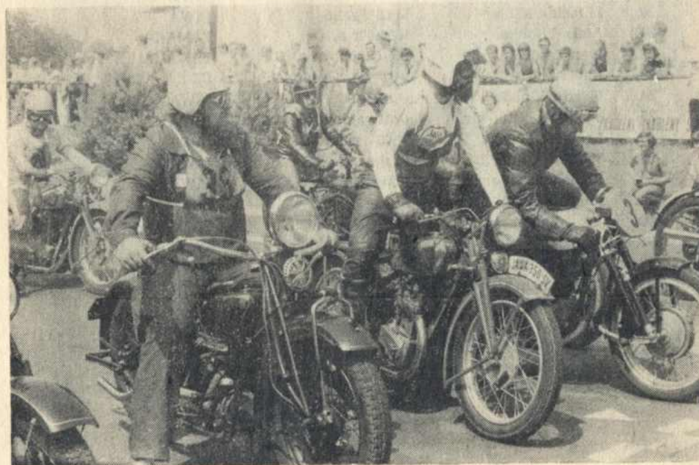
Ukázky motocyklů VETERÁN 1983