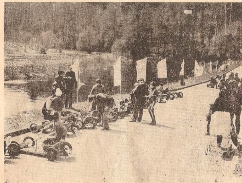
Při práci s mládeží jsou minikáry nejpřitažlivější