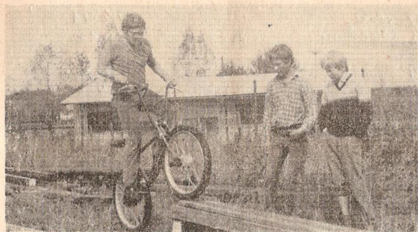
První začátky „motoristy“ — cyklotrial . . .