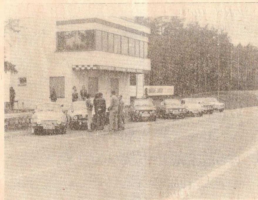
Další pokračování v životě motoristy . . .