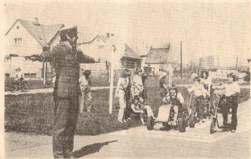
Dopravní výchova na dopravním hřišti ZO Svazarmu AMK Jindř. Hradec