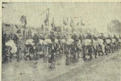
Před startem třídy 350 ccm