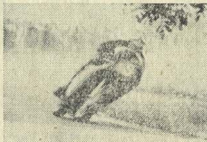
Zasloužilý mistr sportu F. Štastný v plně jízdě